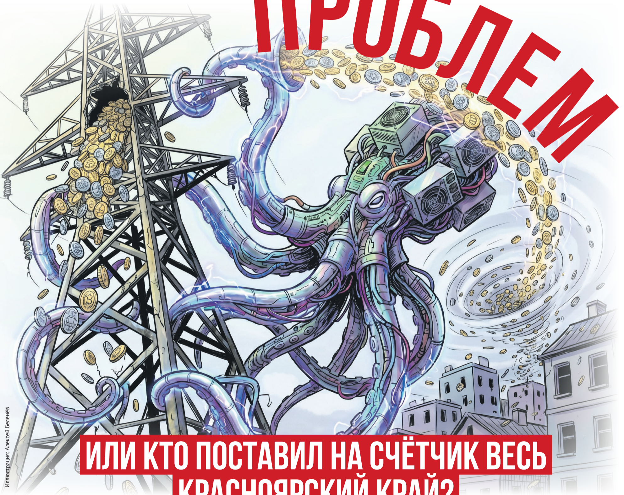
Иллюстрация: Алексей Беленив

ИЛИ КТО ПОСТАВИЛ НА СЧЁТЧИК ВЕСЬ КРАСНОЯРСКИЙ КРАЙ?