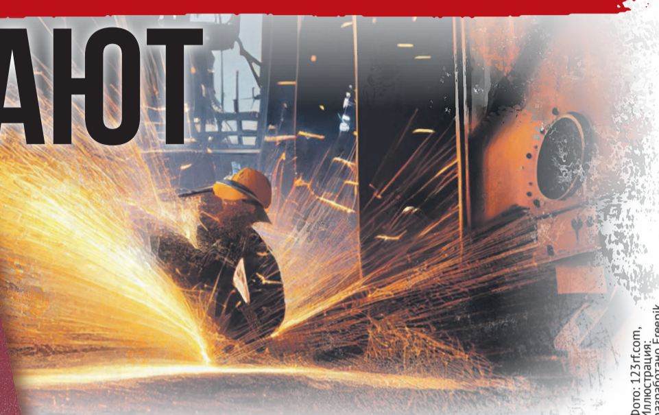
Фото: 123rf.com. Иллюстрация: разработано Freepik