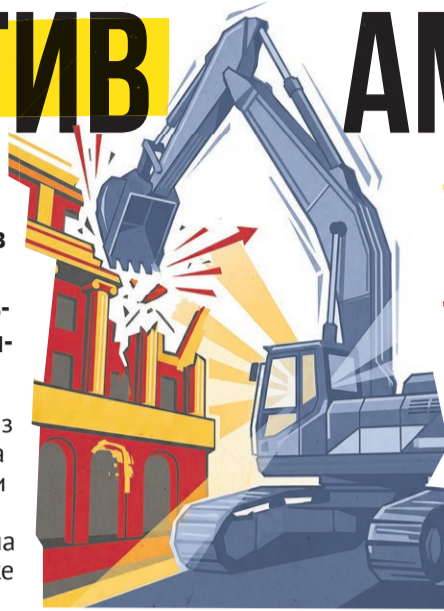
Иллюстрация: Алексей Беленёв