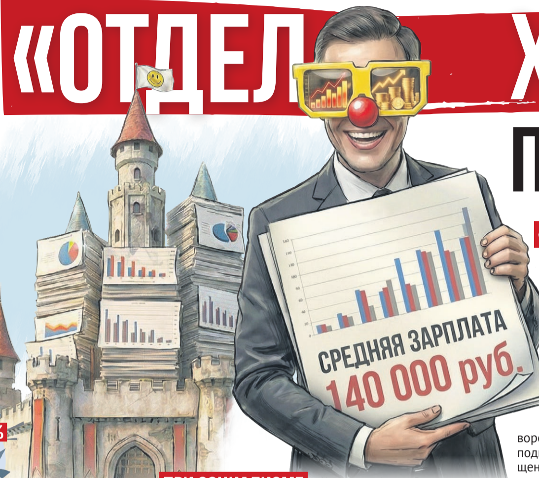
Иллюстрация: Алексей Беленев