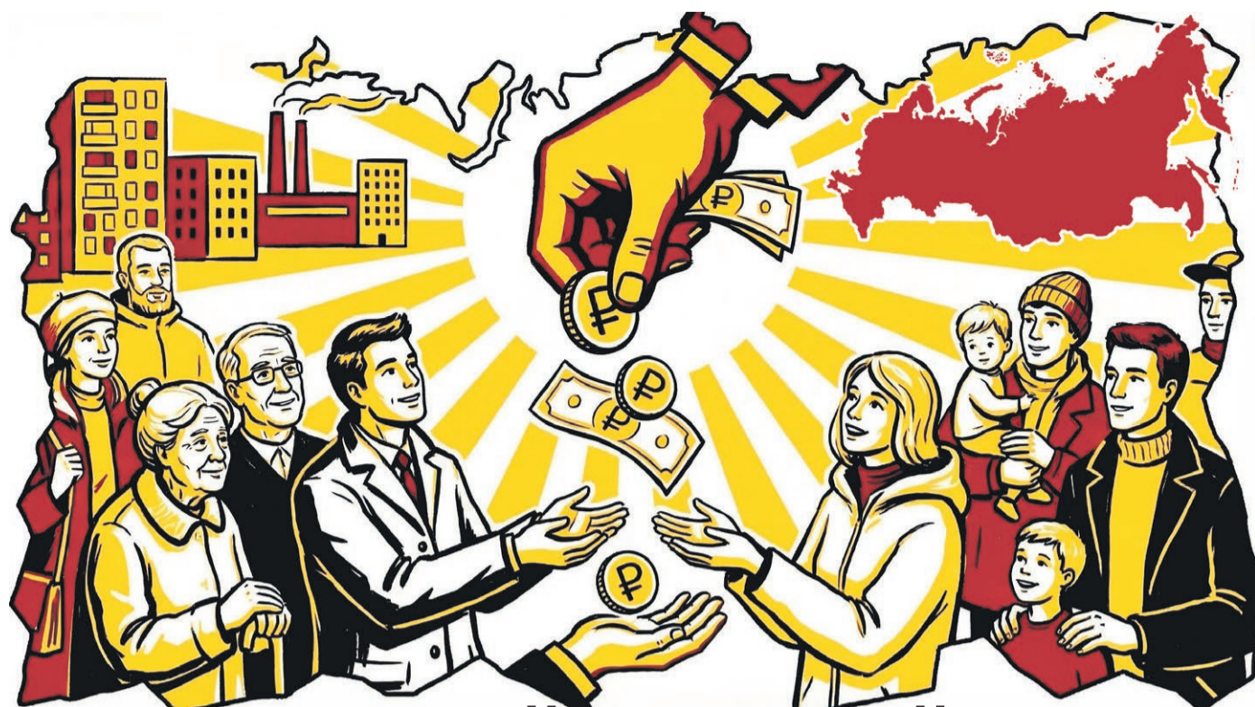
Иллюстрация: Сергей Попов

Карманы граждан пустеют из-за роста цен, тарифов и услуг. Особенно тяжело приходится пенсионерам и семьям с детьми. В СПРАВЕДЛИВОЙ РОССИИ уверены, что поддержать самые уязвимые категории россиян сможет справедливый базовый доход (СБД) — по 10 тысяч рублей ежемесячно каждому гражданину нашей страны.